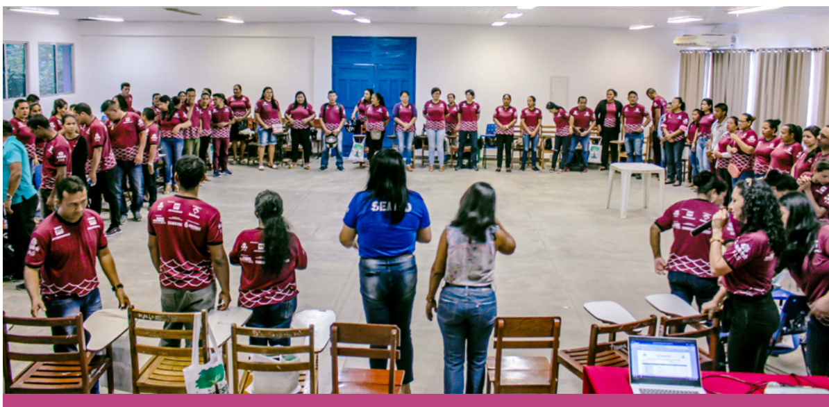
Dinâmicas em grupo fizeram parte das formações de professores.

Vale destacar que, a partir do ano de 2020, a formação passou a ocorrer remotamente por conta da pandemia de Covid-19, o que tornou a execução do projeto ainda mais desafiante, visto que