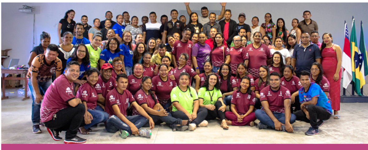
Resultado da 2ª etapa de formação de professores do ensino multisseriado em Tefé/AM.

Coari, a oficina ocorreu entre os dias 16 e 17 de outubro e contou com 108 participantes de comunidades ribeirinhas e indígenas, além do suporte técnico de quatro coordenadoras da secretaria de educação do município. Simultaneamente, em Tefé, a oficina agregou 41 participantes de 13 comunidades ribeirinhas e indígenas. Em Uarini, a oficina, que também ocorreu no mesmo período, reuniu 54 participantes sob o suporte de três coordenadoras. Já em Maraã, o evento aconteceu nos dias 27 e 28 de novembro de 2020, com a participação de 38 professores.