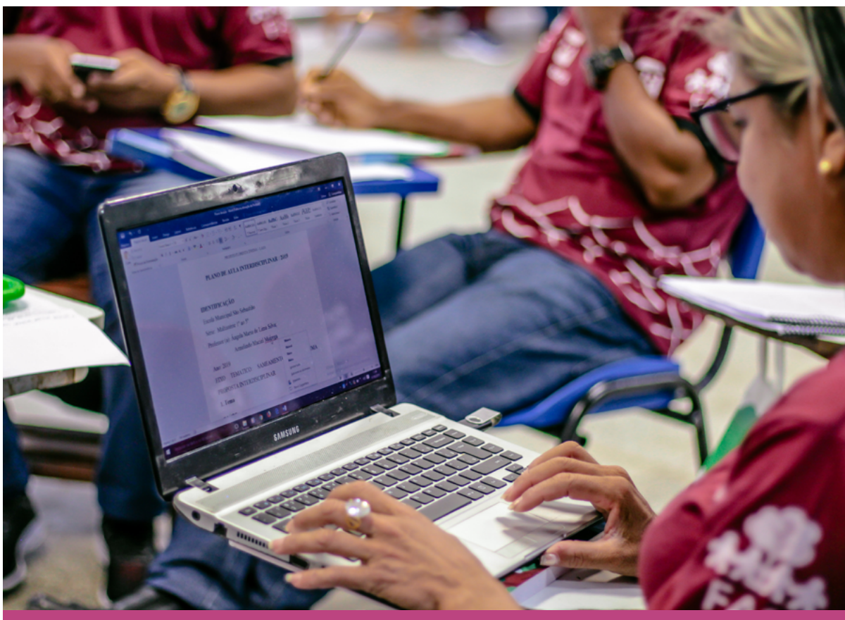
Professores idealizam plano de aula para a modalidade multisseriada.

e a aplicação de debates, além da utilização dos Guias de Atividades (GDAs), um material didático desenvolvido para que os professores pudessem aplicá-los durante as aulas com os alunos. Além de serem beneficiados com kits escolares, camisetas e cartilhas de atividades, os professores também compreenderam a importância de delinear planos de aula e receberam apostilas elaboradas estrategicamente para a modalidade multisseriada. O material serviu para subsidiar o trabalho pedagógico, com foco nos elementos da natureza e conceitos entrelaçados às questões ambientais, de modo a abrir o debate acerca da sustentabilidade e, assim, impactar positivamente as comunidades ribeirinhas da Amazônia.