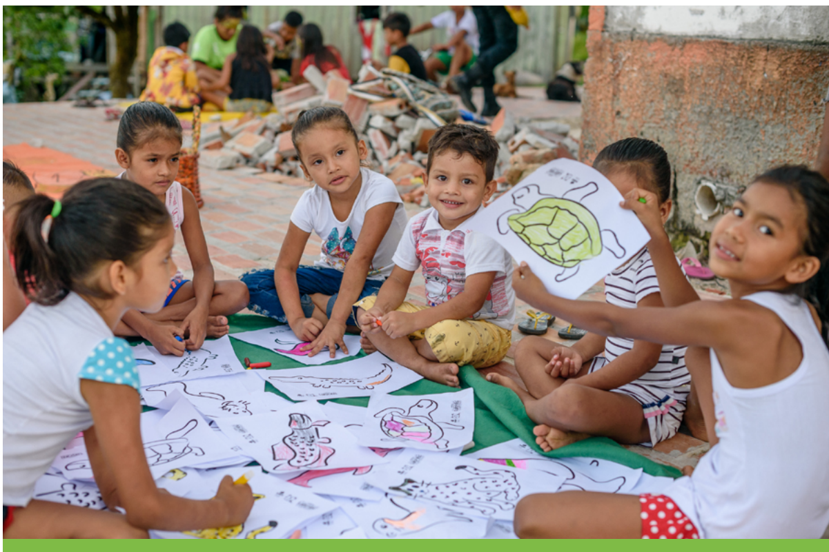
A conservação da biodiversidade e a diversidade de espécies amazônicas foi tema de encontros do projeto.