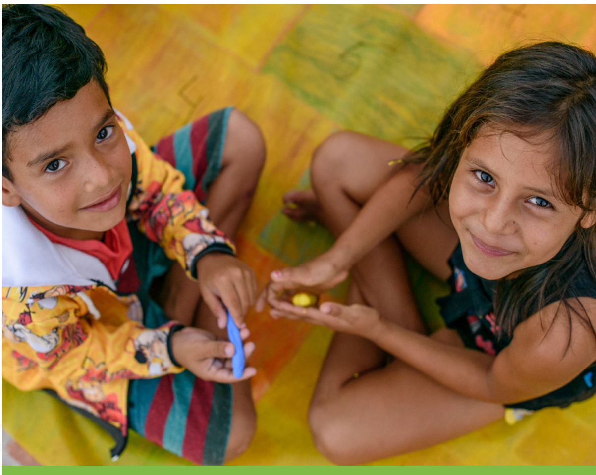
O festival Agita Punã foi considerado um sucesso pelos comunitários, que foram envolvidos em todo o processo participativo.

abordou as histórias de vida dos idosos sobre o surgimento da Casa Punã, entrelaçadas às estratégias de uso dos recursos naturais da Amazônia em um período de 100 anos. Durante o Agita Punã, as oficinas de Monitoramento Participativo com os jovens monitores da biodiversidade e do geoprocessamento evidenciaram os resultados obtidos em um período de três meses, fortalecendo a necessidade de manter presente o conhecimento popular no cotidiano das comunidades ribeirinhas. Os monitores da biodiversidade abordaram conceitos básicos de ecologia de espécies da fauna amazônica nos jogos ambientais no Espaço Curupira.