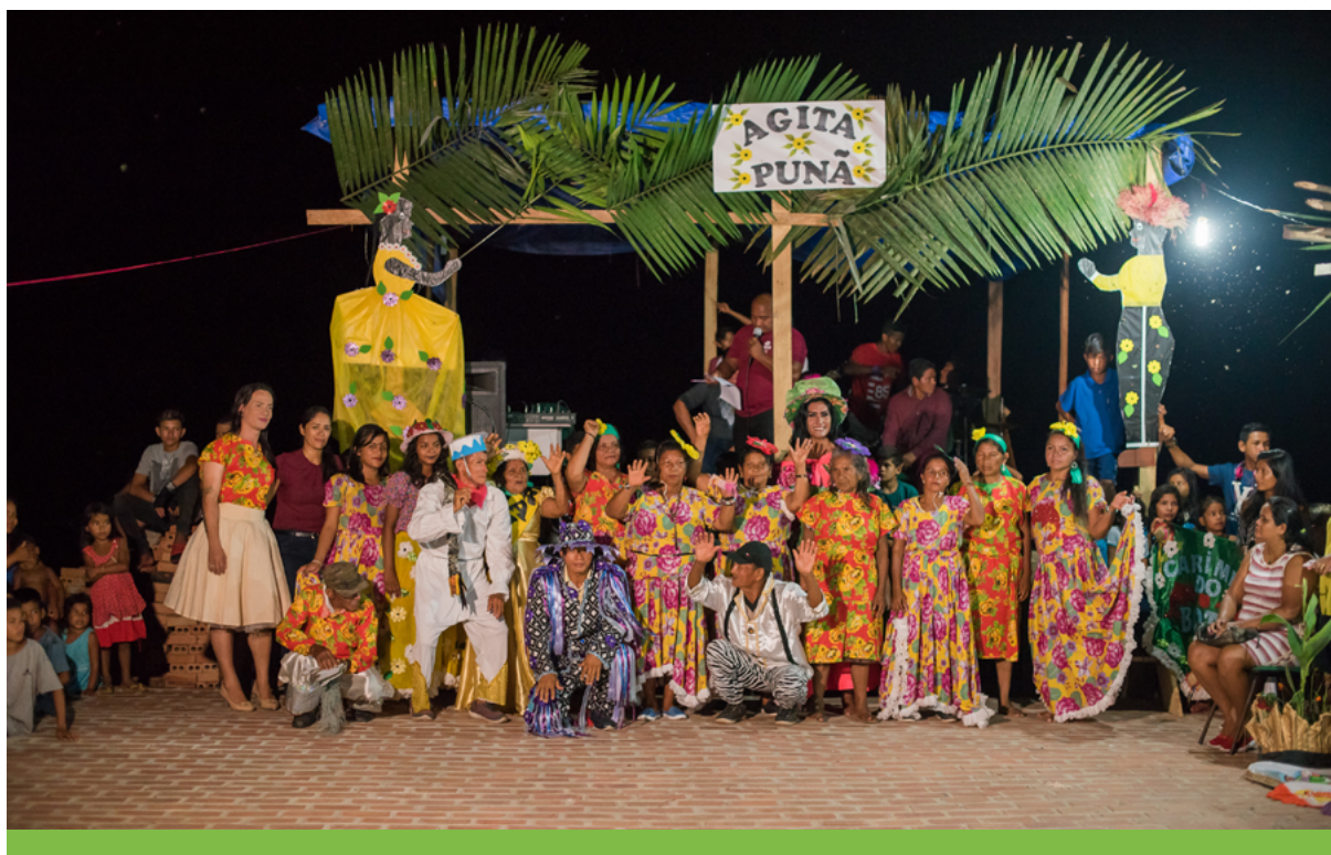
Em 2019 ocorreu o Agita Punã, um evento que agregou as ações do Projeto Amazonas Sustentável e promoveu dinâmicas culturais.

As oficinas sobre monitoramento ambiental participativo também contribuíram no desenvolvimento deste componente, garantindo engajamento e participação. Na perspectiva da pesquisa participante, permitiu-se a criação de uma “comunidade da conservação”, envolvida em prol do reconhecimento de identidades, história e cultura locais, a partir da ótica da conservação das espécies-bandeiras. Os chamados Diagnósticos Rápidos Participativos (DRPs) também foram utilizados para compreender a dinâmica da comunidade dentro de uma perspectiva histórica, sendo que o conceito de conservação ex situ serviu para a estruturação de uma proposta de jardins botânicos, relacionando o etnoconhecimento das comunidades ribeirinhas.