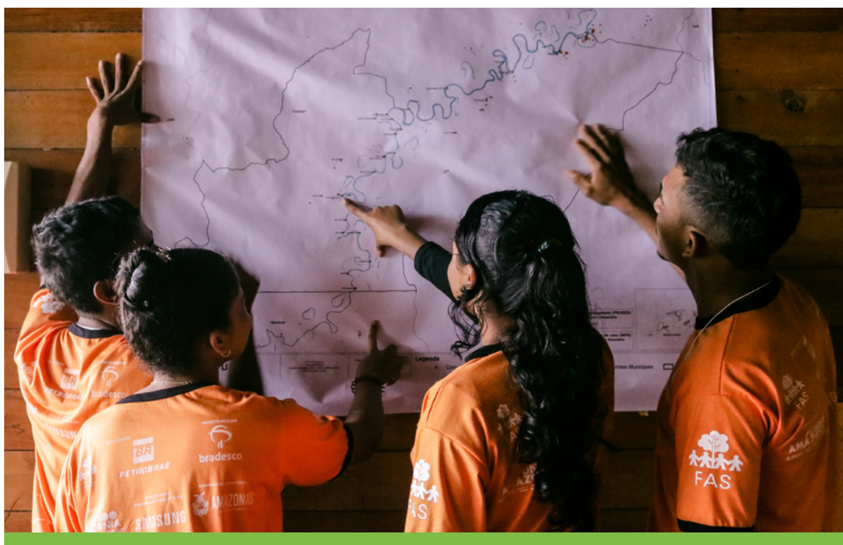
Durante oficina, realizada na Reserva de Desenvolvimento Sustentável (RDS) de Uacari, os estudantes aprenderam a ler e interpretar mapas.

Iniciada em 2019 para auxiliar em tratativas, tomadas de decisão e na elaboração e execução de políticas públicas ambientais no Amazonas, o quinto componente do projeto teve como foco o fortalecimento do monitoramento ambiental participativo e a conservação da biodiversidade em cinco UCs estaduais consideradas estratégicas, tanto em termos educacionais