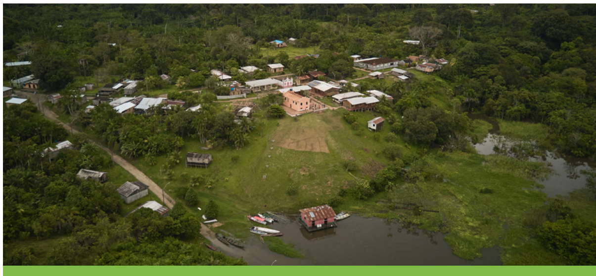
Vista aérea da comunidade Punã.

Quanto à conservação da biodiversidade, que está diretamente relacionada às ações de monitoramento, consideramos dois aspectos principais: qualificação de capital humano local para multiplicar conhecimentos e experiências em monitoramento e conservação da biodiversidade; promoção e participação do aprimoramento integrado e contínuo, relacionado aos conhecimentos técnicos e operacionais e troca de vivências. A partir disso, esperamos estimular a adoção de práticas de cultivo de espécies de interesse cultural, econômico e ambiental para encorajar o comportamento de conservação da flora amazônica. Por fim, criamos espaços de diálogos sobre o conhecimento relacionado à conservação ex situ e in situ , além de conceitos sobre botânica, entomologia, agricultura familiar, controle de pragas e turismo.