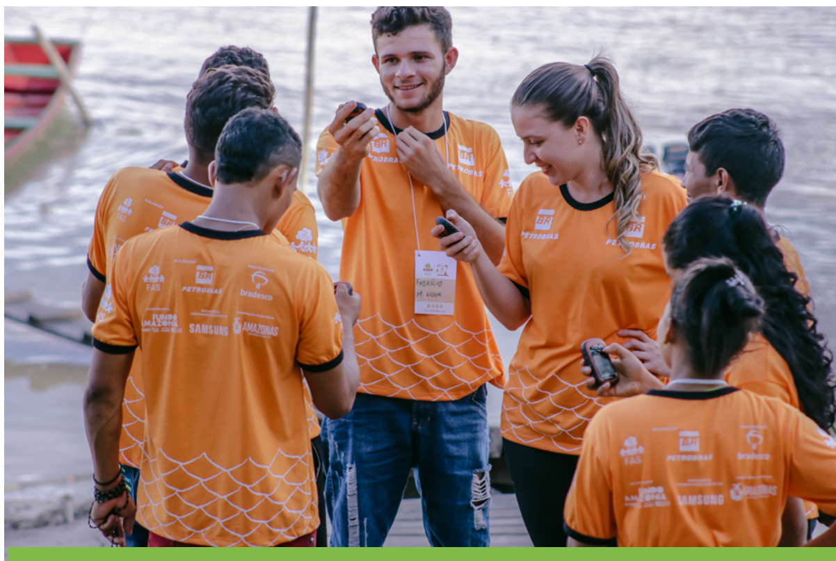
Jovens aprenderam a utilizar ferramentas como o GPS para monitorar focos de calor em campo.

avaliar, de forma precisa, os dados relacionados às taxas de degradação florestal, tomamos como base dados oficiais de desmatamento e focos de calor disponibilizados pelo Programa de Cálculo do Desflorestamento da Amazônia (Prodes) e pelo Programa Queimadas, do Inpe. Os dados de incremento anual de desmatamento e valores absolutos de focos de calor, registrados dentro das Unidades de Conservação abrangidas pelo programa, foram armazenados no Banco de Dados GEOFAS para análises subsequentes.