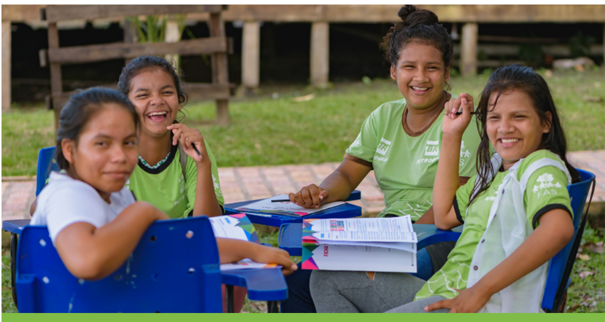
As dinâmicas também ocorreram em espaços externos, na sombra de árvores, de modo a envolver melhor os alunos.

Após as fases das oficinas de monitoramento e de seleção das espécies-bandeira, propusemos a seleção dos monitores da biodiversidade, que passou por duas fases: sensibilização de alunos das duas escolas (estadual e municipal) e participação de todos na escolha das espécies-bandeiras. Adicionalmente, prosseguimos com a seleção dos monitores da biodiversidade que contribuíram para a formação de jovens líderes na comunidade Punã que tiveram como foco o monitoramento ambiental das espécies-bandeira. Eventualmente, foram necessárias formações mais específicas que abordaram temas como: unidades de conservação, noções de Ecologia, marcos da legislação de ambiental, aspectos da biodiversidade; espécies-alvo de fauna e flora regional, inserção de formulários para o monitoramento das espécies-alvos; noções de matemática, sistematização de dados e análises preliminares.