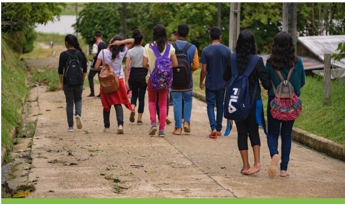
Durante as oficinas, os alunos da RDS Mamirauá passearam pela comunidade Punã para observar as espécies presentes no local e estudá-las.

A oficina sobre estratégias de conservação das espécies-alvo da Amazônia e a capacitação de jovens ocorrida em setembro, na comunidade Punã, foram fundamentais para a elaboração do material didático nas atividades extracurriculares. Considerando aspectos socioambientais e históricos, optamos pela construção participativa baseada no conhecimento popular para a produção do material didático para as atividades extracurriculares. Nessa fase do DRP, houve a participação dos educandos do ensino fundamental I e II na aplicação das ferramentas participativas “Mapa da comunidade” e “Linha do tempo” para definição das espécies-bandeira, com reuniões em grupo e abordagens sobre saúde, recursos naturais, festas, religião e educação.