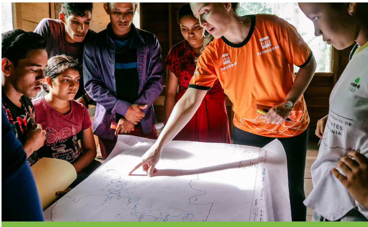
A RDS de Uacari foi uma das unidades de conservação contempladas com oficinas de monitoramento geoparticipativo.

No período de setembro a outubro de 2019, as ações executadas pelo monitoramento ambiental participativo se resumiram à atualização mensal dos dados sobre focos de calor, além da elaboração e revisão de um cartaz de divulgação científica - material que teve como objetivo sensibilizar a população a respeito da importância de combater as queimadas. Os meses de outubro a dezembro foram destinados ao acompanhamento das atividades nas cinco UCs e à elaboração de mapas de acompanhamento dos focos de calor.