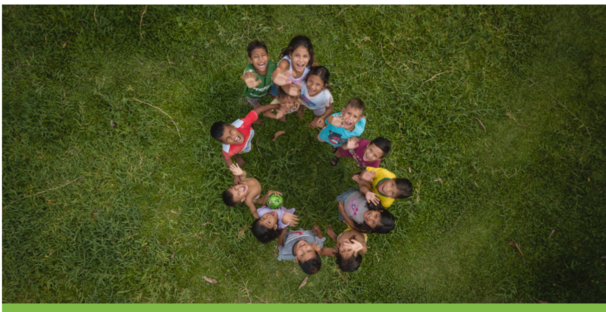
Em 2019, as crianças participaram em massa do Agita Punã.

Quanto ao quesito formativo envolvendo as escolas, os professores observaram a necessidade de formações para a elaboração de um caderno no contexto da geografia, história, do ensino de ciências e língua portuguesa. As oficinas de produção de mudas também serviram para incentivar a substituição das áreas de roçados pelo Sistema Agroflorestal, com a utilização de espécies como: bacaba, açai, cupuaçu, cacau e abacaxi. O resultado desse mapa subsidiou na definição das práticas de educação ambiental pautada em estratégias de conservação ex situ para a estruturação do Plano de Ação de Projeto Piloto do Jardim Botânico Punã.