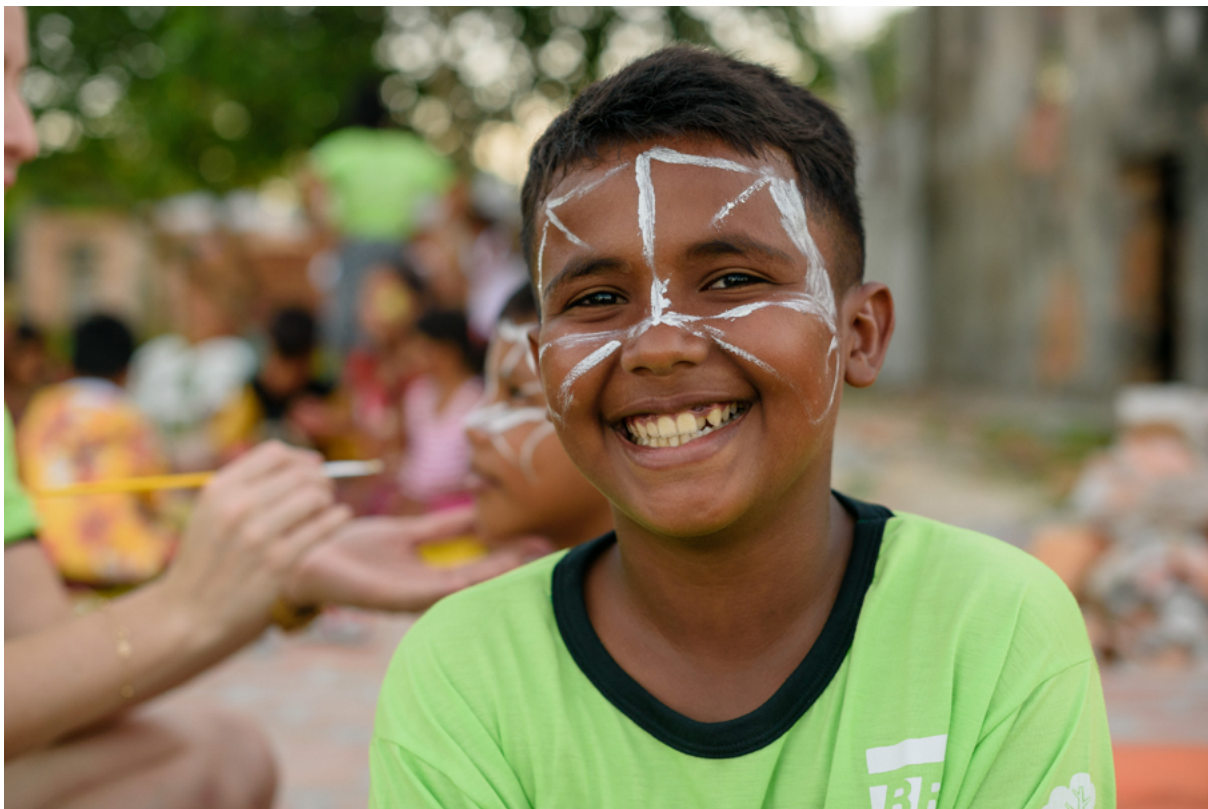
As crianças participaram de várias na atividades, durante o projeto.

Do ponto de vista socioambiental, consideramos, portanto, extremamente pertinentes as contribuições ofertadas pela ação 5. Por meio do uso de tecnologias de ponta e sob o amparo científico e educacional, obtivemos soluções que podem servir de modelo para a implementação de iniciativas semelhantes em outras localidades da Amazônia Legal, da Pan-Amazônia e até mesmo de outros países ao redor do globo. Ademais, ações como essa corroboram para a perpetuação dos modos de vida de povos tradicionais, ao mesmo tempo em que protejam o meio ambiente onde vivem.