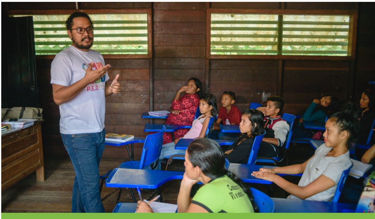
As temáticas abordadas em sala de aula permitiram uma maior compreensão por parte dos alunos sobre questões ecológicas e de conservação.

Em termos de sensibilização da biodiversidade e tendo como público alvo adultos, crianças, jovens e idosos, foi possível atingir a meta de transmitir o conhecimento popular e científico sobre a biodiversidade florística da Amazônia no aprendizado de habilidades para práticas sustentáveis. Os participantes se engajaram no desenvolvimento do Jardim Botânico Punã, um espaço que serviu para retratar a biodiversidade da floresta amazônica por meio da abordagem de aspectos culturais e históricos de espécies de plantas da região do médio Solimões. Além disso, professores e alunos foram capazes de identificar a flora da região e adotar, nas salas de aulas, assuntos que abordavam conceitos como: manejo sustentável, serviços ambientais, áreas protegidas, diversidade biológica e espécies ameaçadas de extinção. Por fim, os comunitários puderam relacionar o grau de valor da flora amazônica em seu cotidiano.