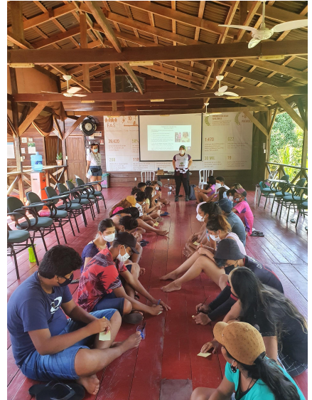
APLICAÇÃO DA OFICINA TEÓRICA 24/11 - TUMBIRA