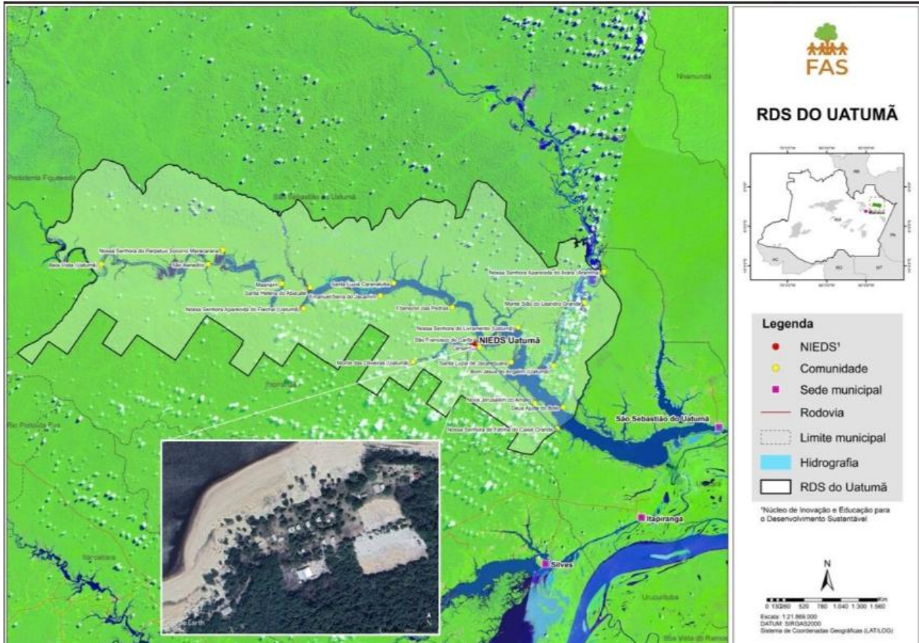
Figura 1 – NIEDS Uatumã na comunidade São Francisco do Caribi, Itapiranga/AM