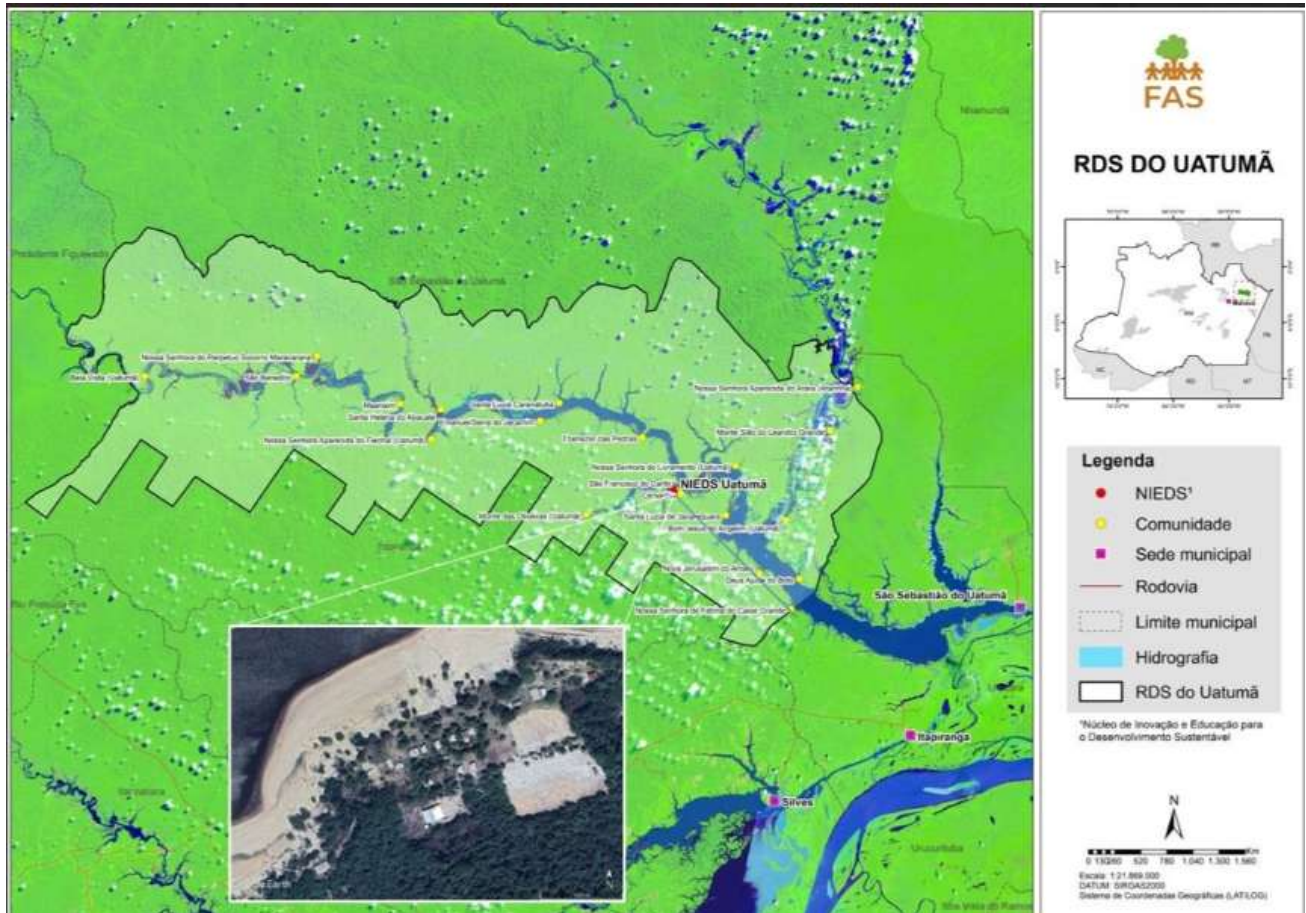
Figura 1 – NIEDS Uatumã na comunidade São Francisco do Caribi, Itapiranga/AM