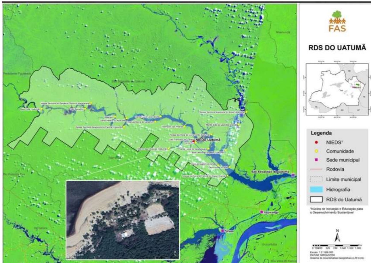
Figura 1 – NIEDS Uatumã na comunidade São Francisco do Caribi, Itapiranga/AM